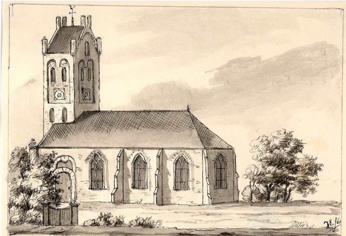
De Kerk te Hlijm in 1723.